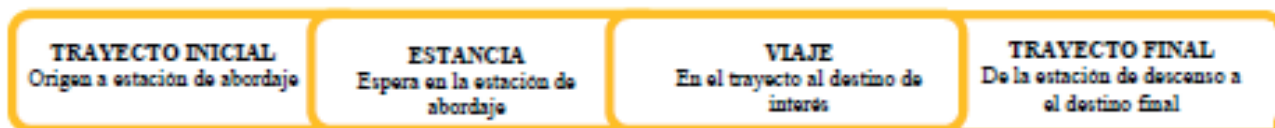
Figura 5. Facetas en las que se presenta la inseguridad en el uso del transporte público

el transporte público se manifiesta a través de cuatro facetas distintas, tal como se detalla en la figura 5.