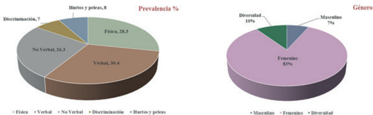
Figura 4. Agresiones y violencia que sufren los usuarios del transporte público

a) Prevalencia de agresiones que sufren los usuarios b) Porcentaje de agresiones por género